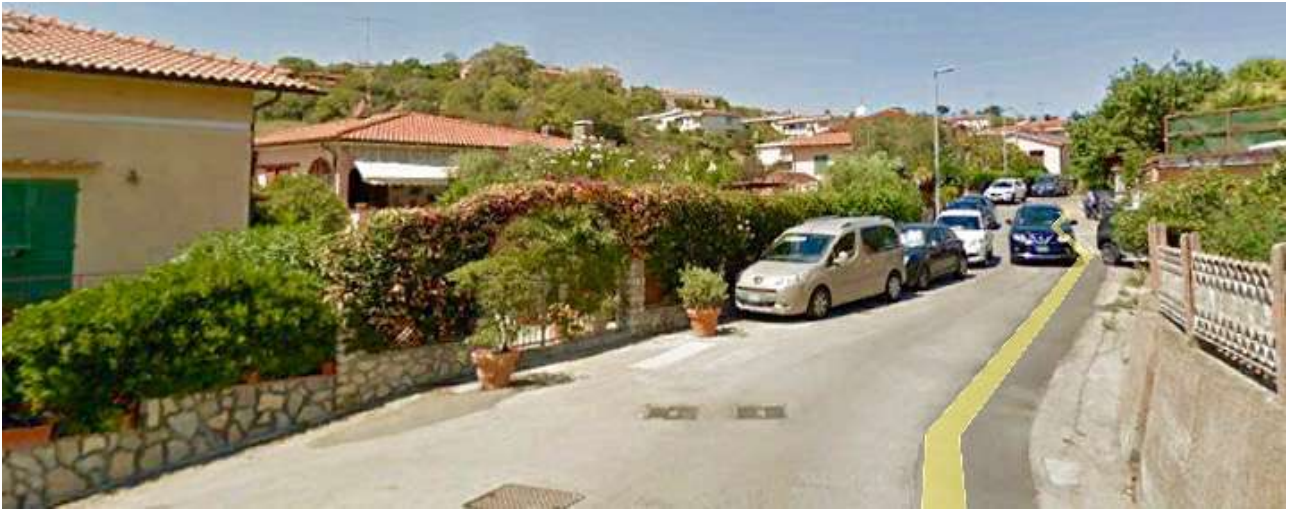
Senza spazi a parcheggio con case direttamente affacciate sulla via della Consumella